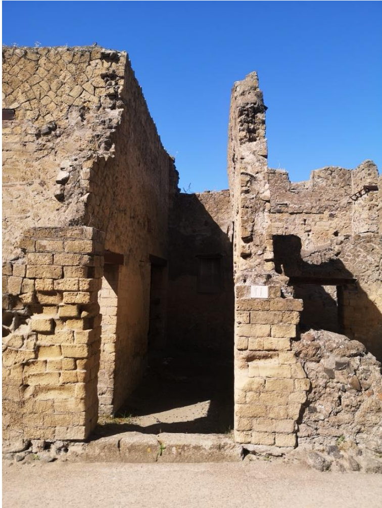
4. Vista da nord