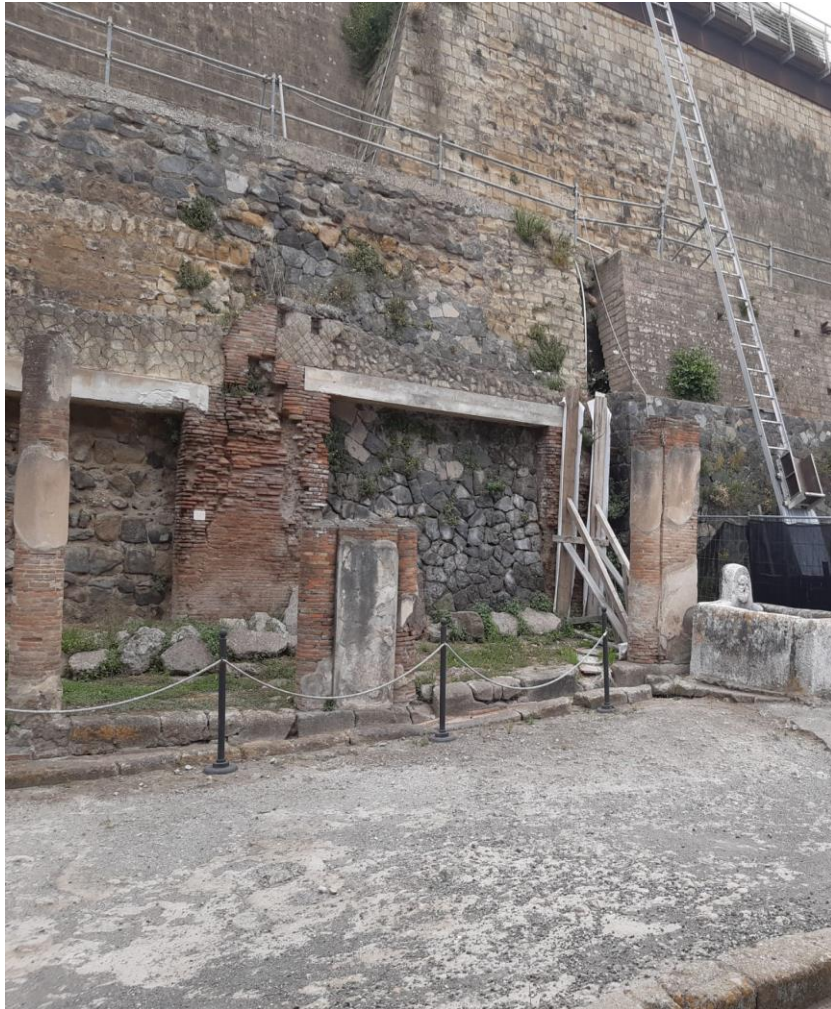
7. Vista da sud-ovest