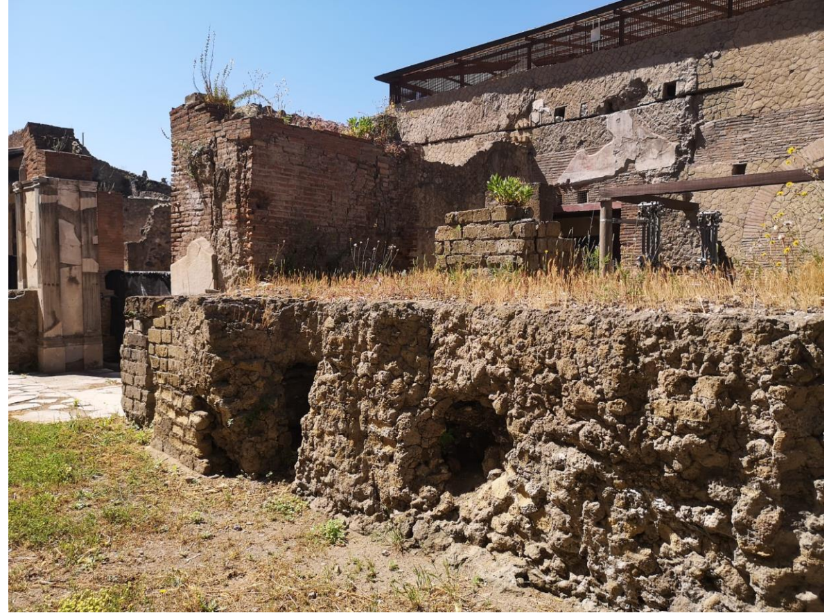
13. Vista da nord-ovest