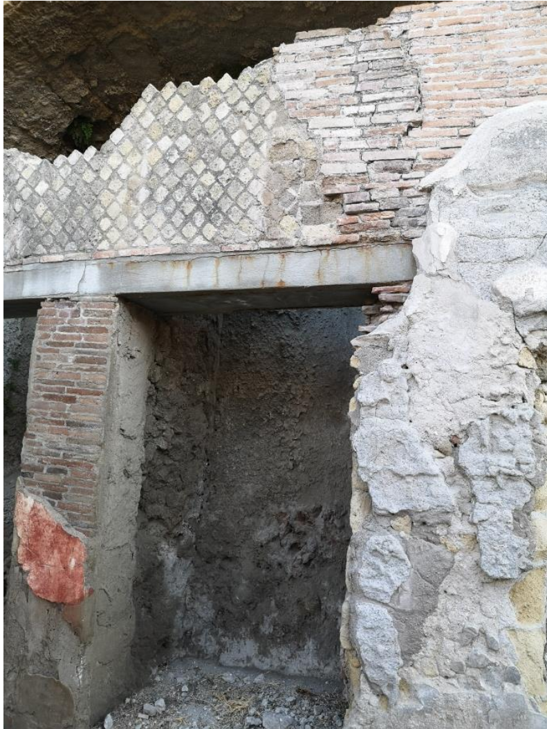
14. Vista da ovest

DECUMANO MASSIMO_PORTICATO OVEST_BOTTEGHE, FSN_C 2-4, UF 255