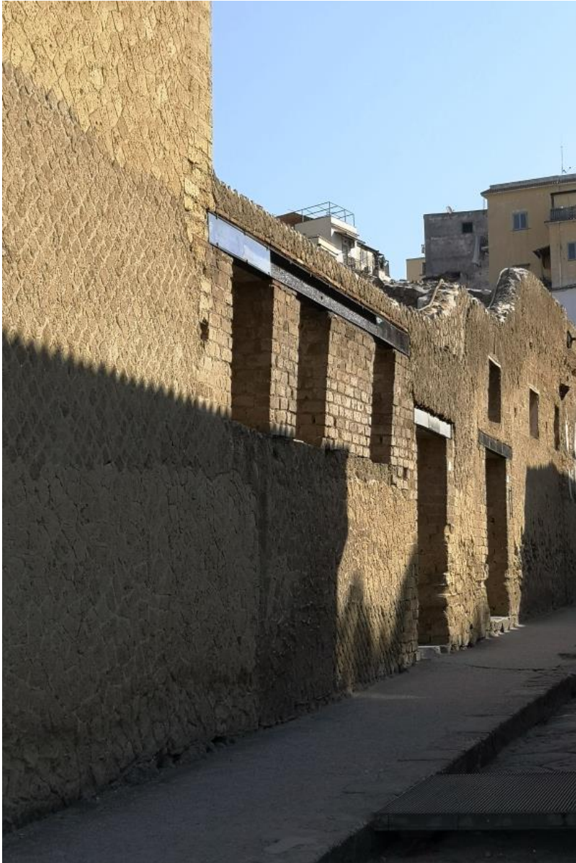
20. Vista da sud est