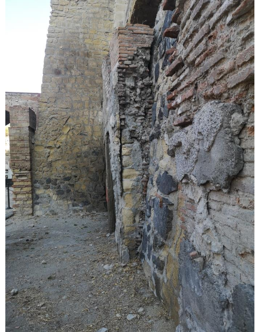
16. Vista da ovest