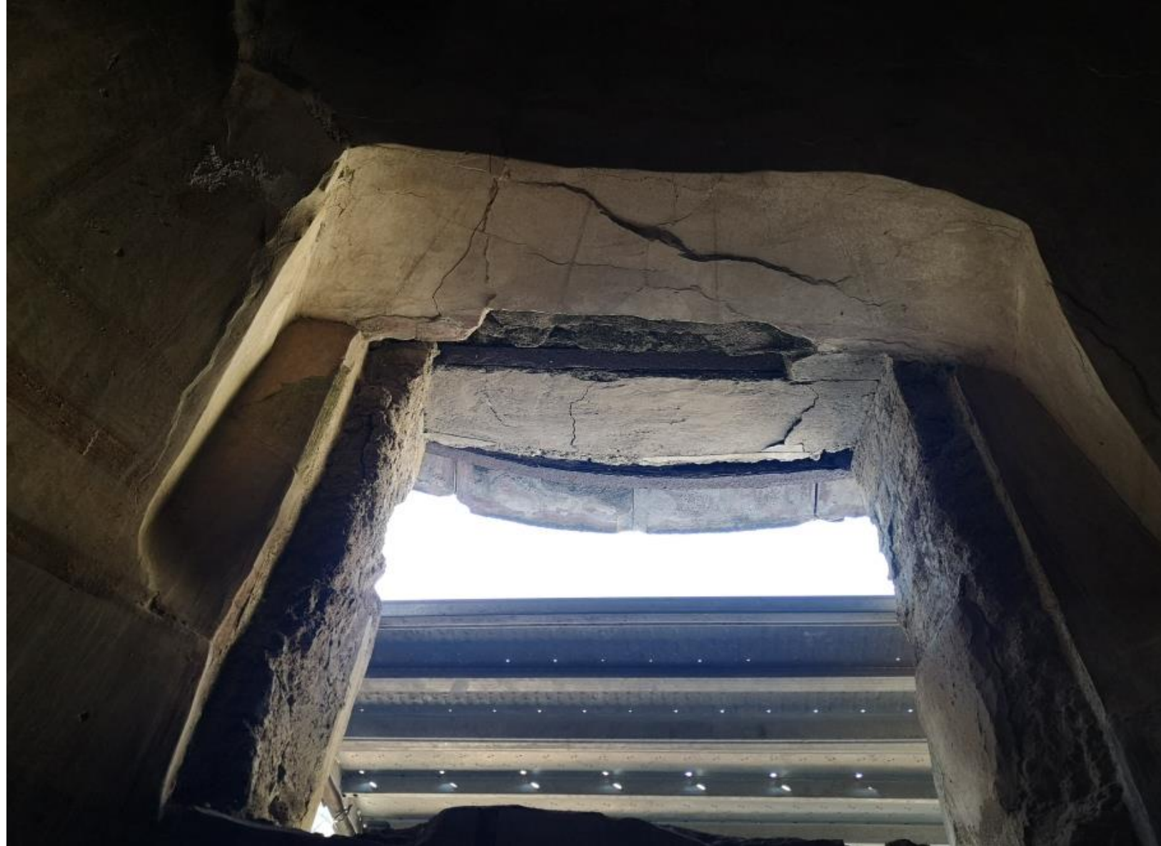
23. Vista da nord