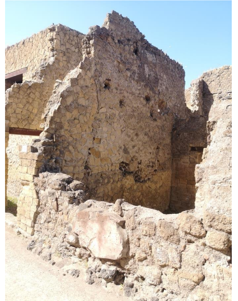
6. Vista da nord-est