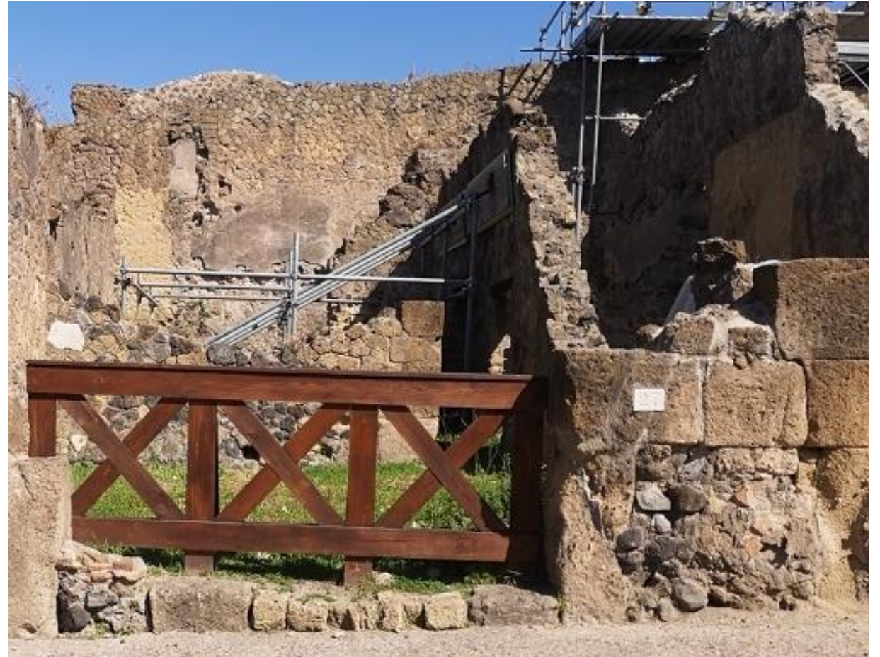
11. Vista da sud-ovest