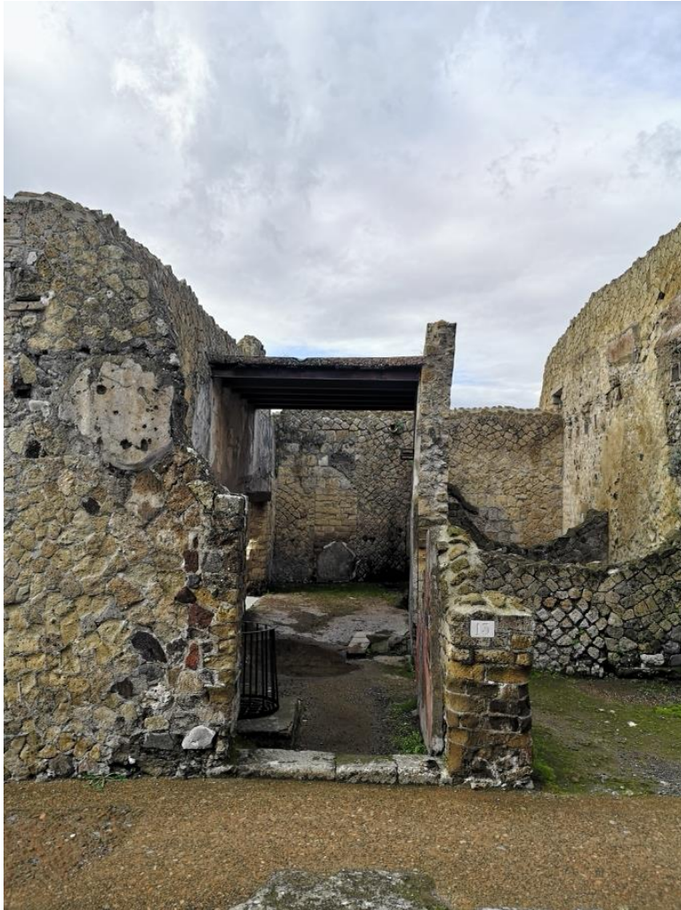
1. Vista da nord