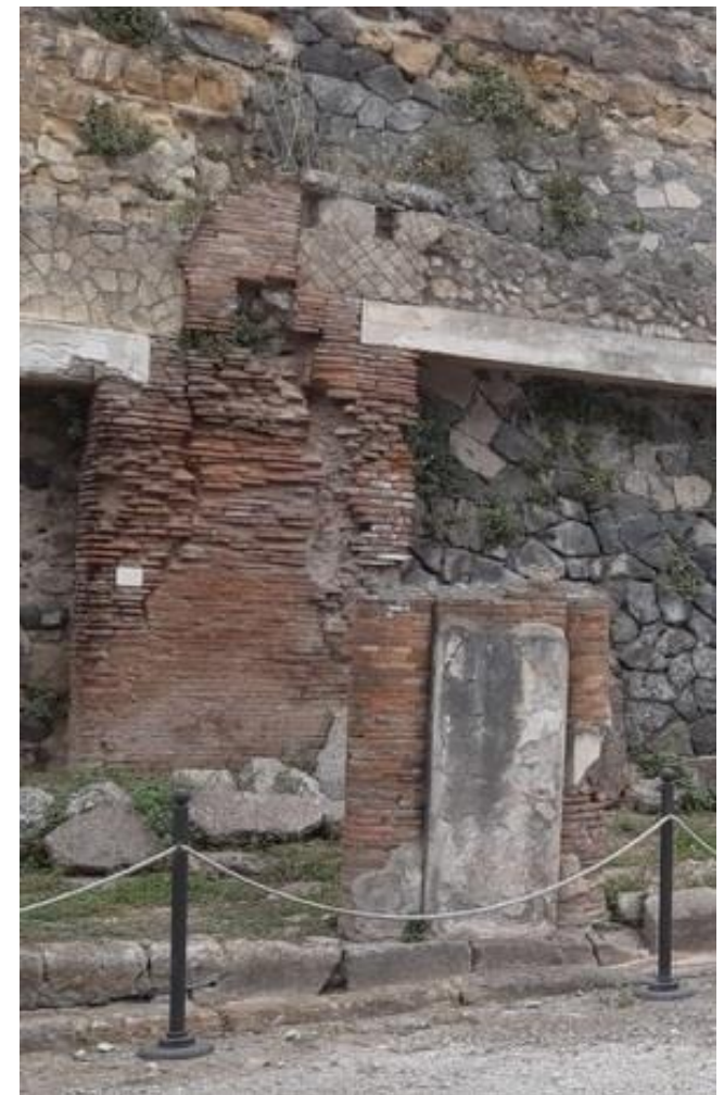
9. Vista da sud-ovest