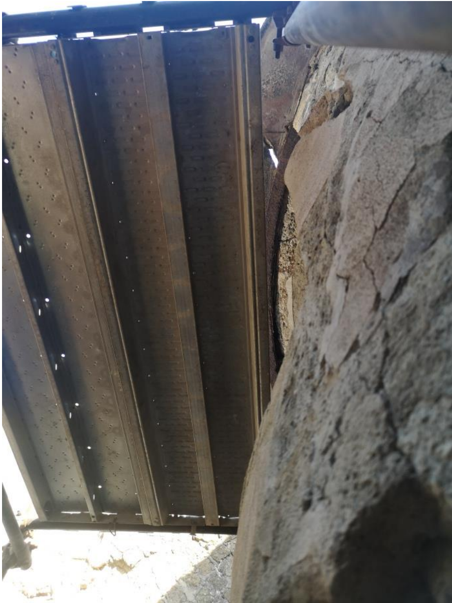
22. Vista da est