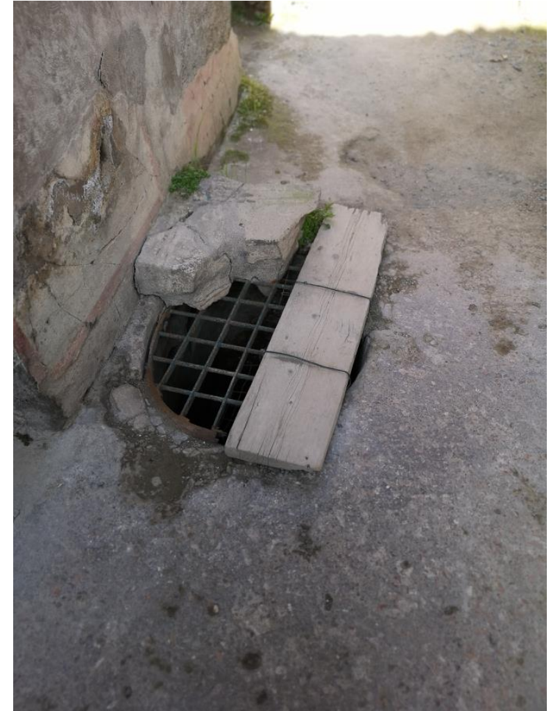
3. Vista da sud-est