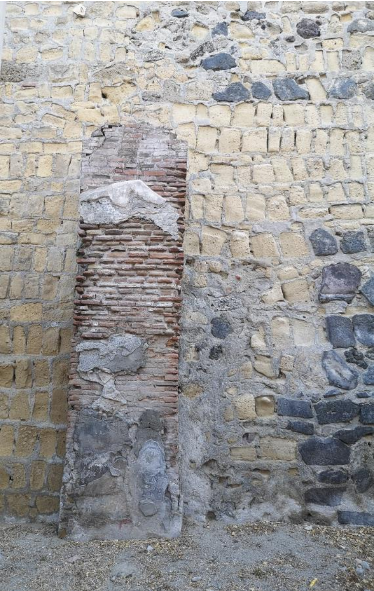
17. Vista da sud