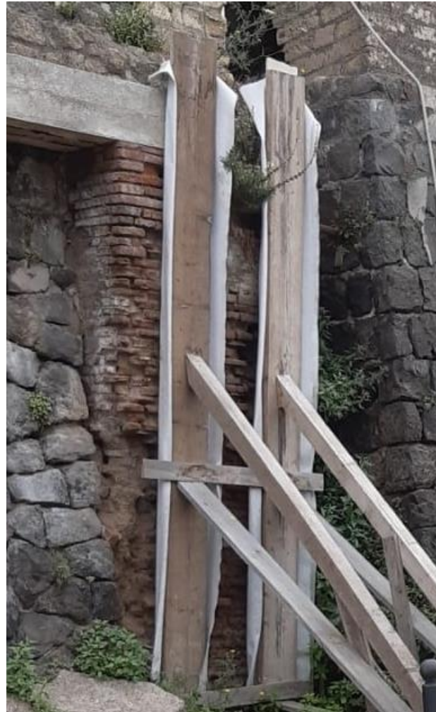
8. Vista da sud-ovest