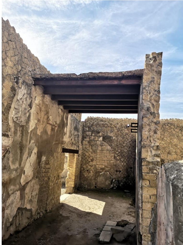
2. Vista da nord