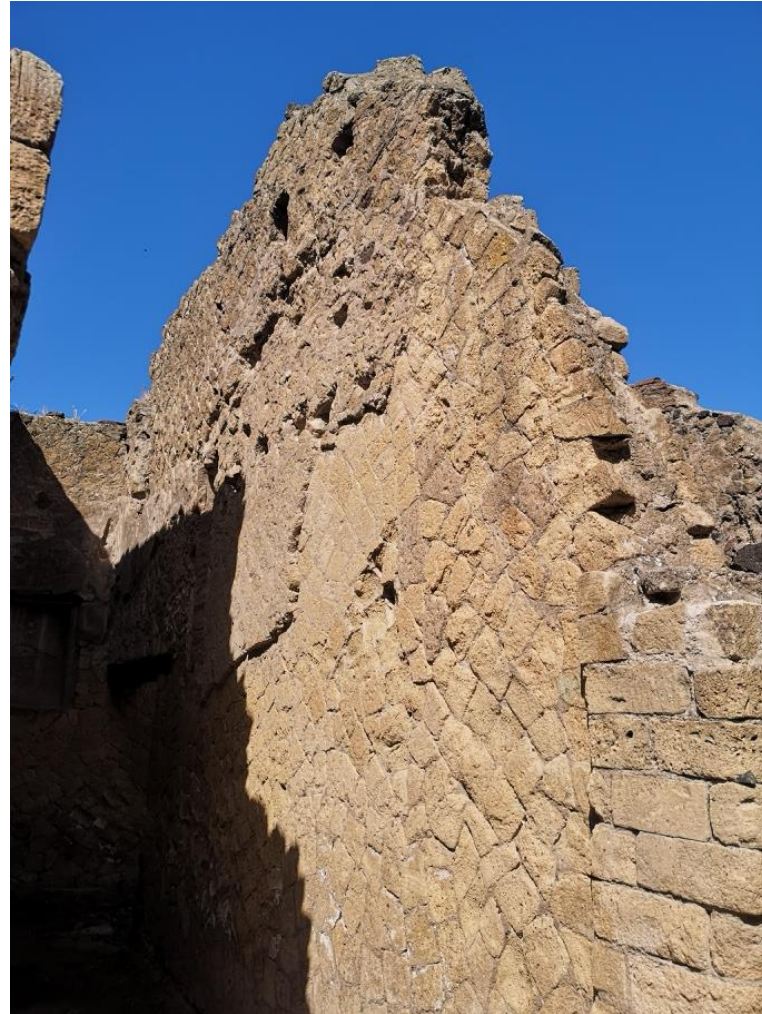
5. Vista da nord-est