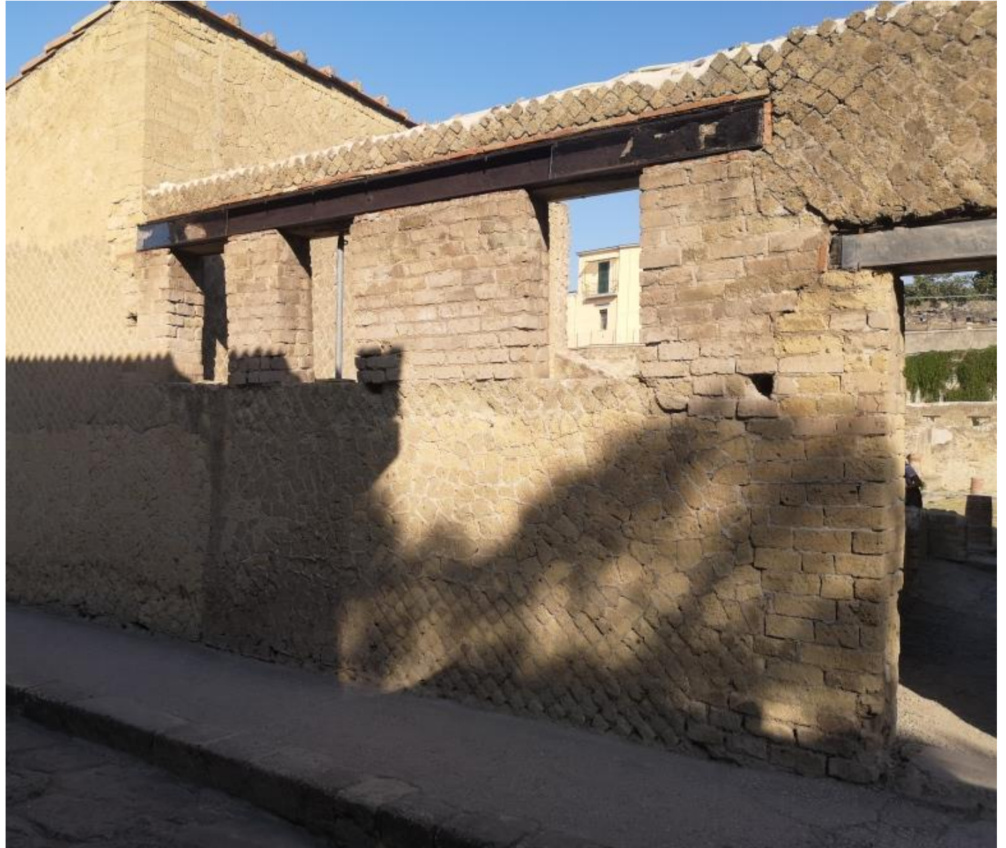
21. Vista da nord est