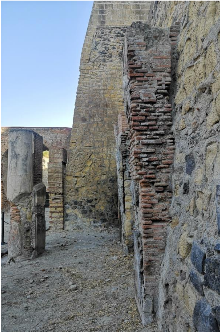
19. Vista da est