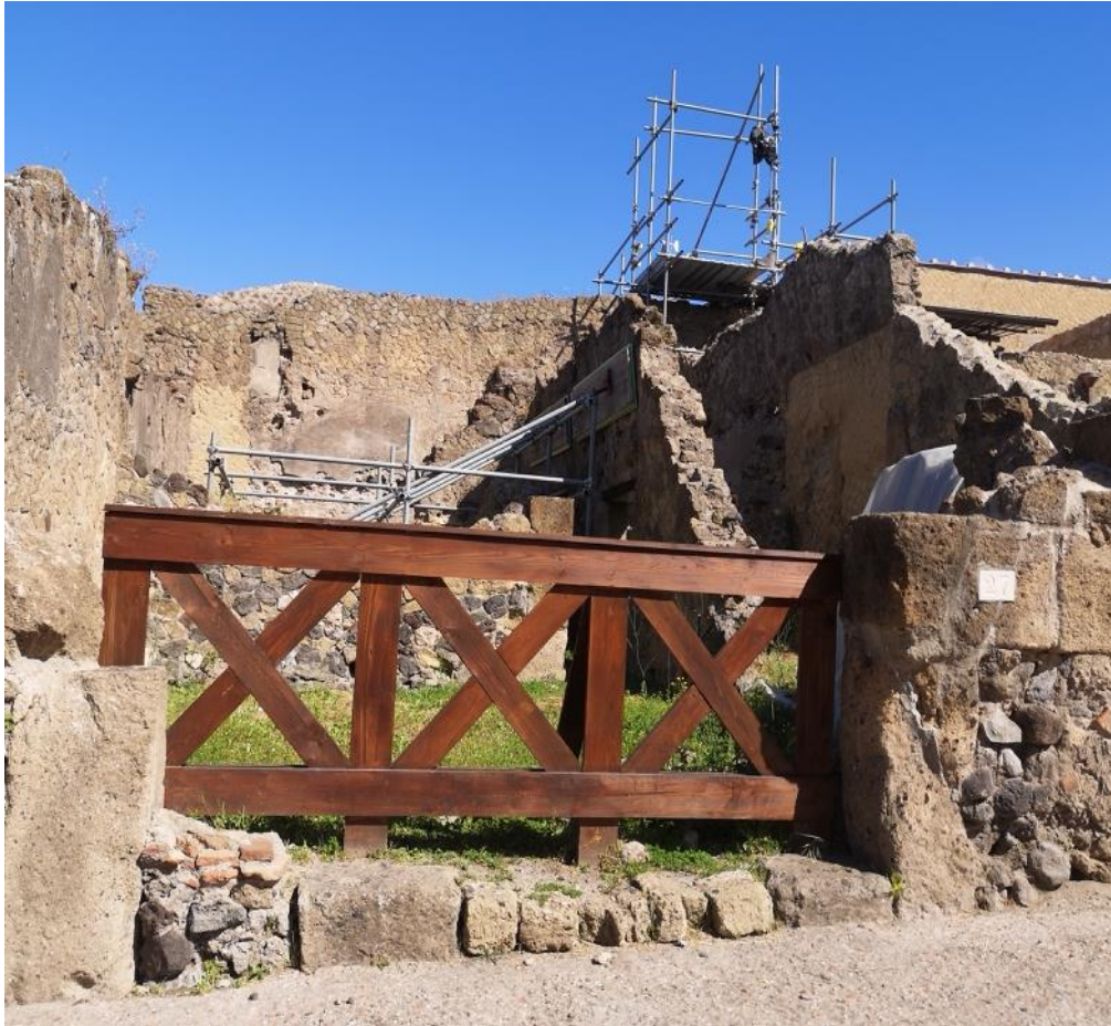
10. Vista da sud-ovest