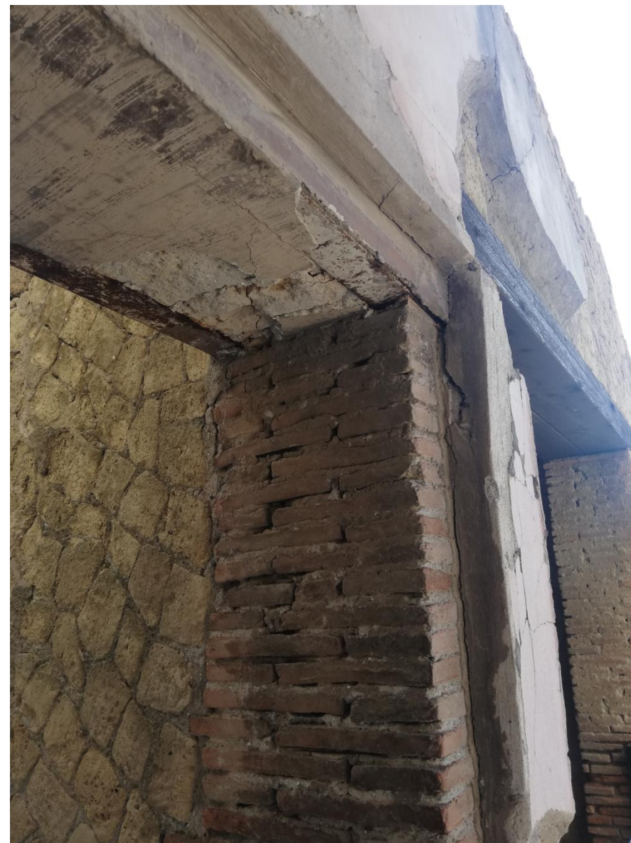
24. Casa del Gran Portale