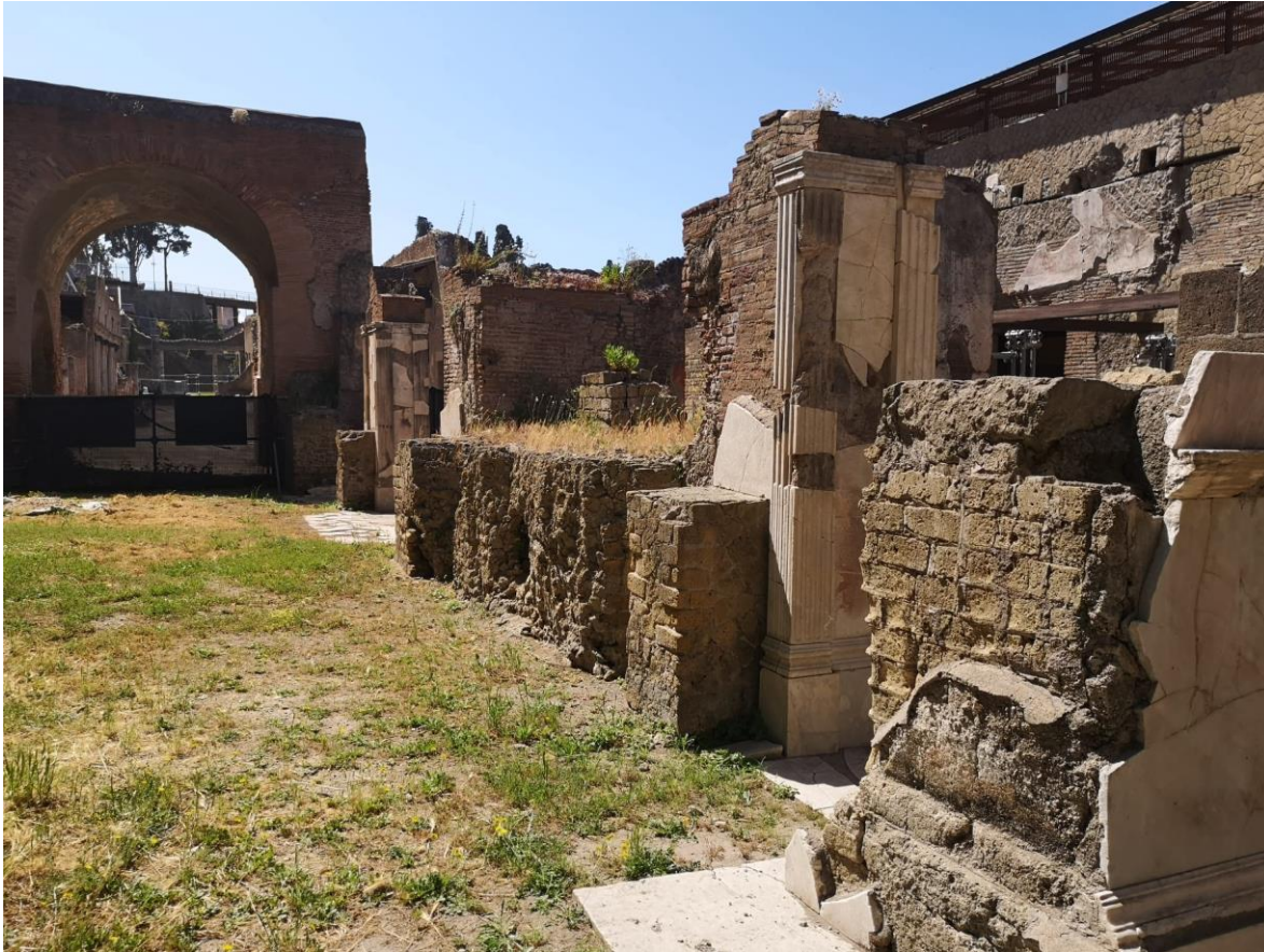
12. Vista da ovest