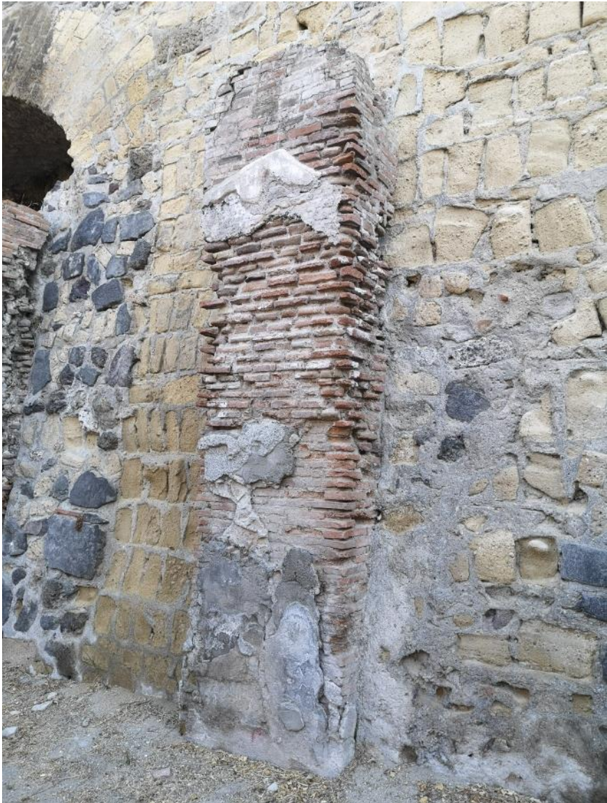
18. Vista da sud-est